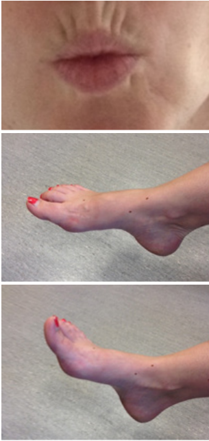
Figuur 1: Hand-, lip- en voetbewegingen tijdens de activatieperiode

De radioloog of verpleegkundige geeft, voor de start van het onderzoek, nogmaals alle uitleg over de verschillende stappen van het onderzoek en over de oefeningen die dienen uitgevoerd te worden. Aarzel niet om vragen te stellen indien er iets niet duidelijk is.