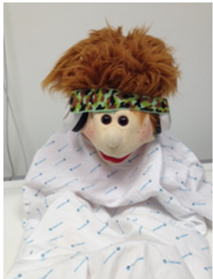
Hoofdtelefoon in kinderformaat.

De MRI-metingen maken een hard, kloppend geluid. Uw kind krijgt een hoofdtelefoon (figuur 2) om deze geluiden te dempen en mogelijke gehoorschade te voorkomen.