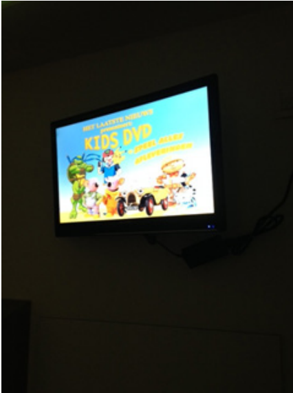
Anesthesiebox met dvd-speler op de MRI-afdeling van de dienst Medische Beeldvorming.

Het is zeer belangrijk dat het kind stil blijft liggen tijdens het MRI-onderzoek. Daarom wordt het kind in slaap gedaan. De anesthesist zal uw kind eerst, in uw bijzijn, in een lichte roes brengen. Als uw kind lichtjes slaapt, wordt u naar de MRI-wachtzaal gestuurd. De anesthesist zal dan een infuus prikken en uw kind volledig in slaap doen. Voor een onderzoek onder narcose dient uw kind nuchter te zijn.