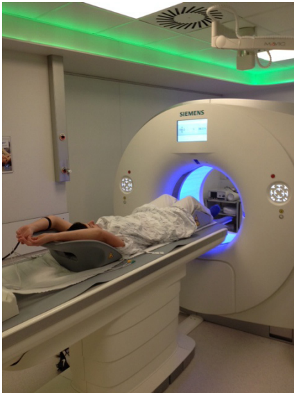
Fig. 1: Positionering tijdens een cardio CT onderzoek

De verpleegkundige zal de ECG elektroden aankoppelen aan het CT-toestel en het infuus wordt verbonden met de pomp waarmee contrastvloeistof zal worden toegediend. Bovendien zal u nog een armband rond uw pols krijgen voor aarding van het toestel.